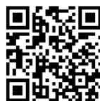
中学生一日体験入学