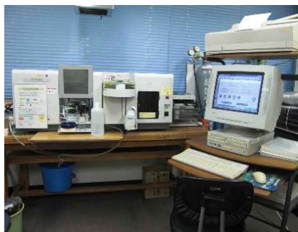
Atomic Absorption Spectrometry