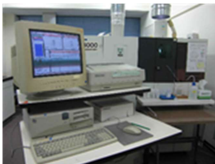
ICP-Optical Emission Spectrometry