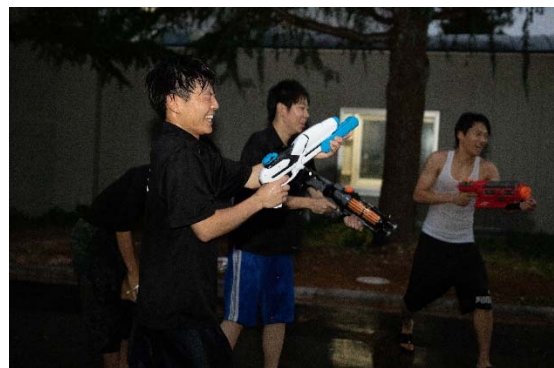
こちらは水鉄砲合戦の様子です。みんなずぶ濡れですね（笑）