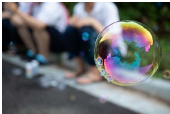
何歳になっても楽しめるシャボン玉。不思議な魅力があります。