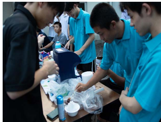
節電川柳を作成した寮生にかき氷が振る舞われました