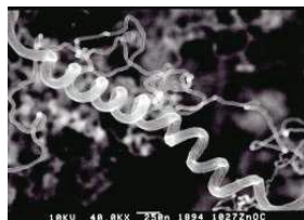
カーボンナノコイル