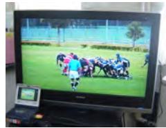
ラグビーのゲーム分析