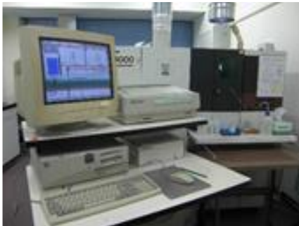
ICP-Optical Emission Spectrometry