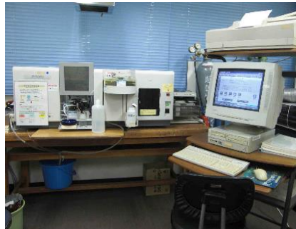
Atomic Absorption Spectrometry