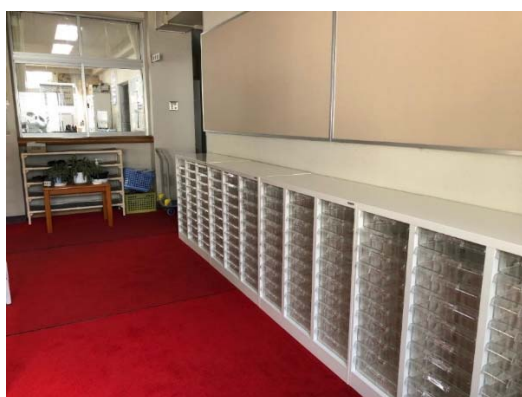
学寮事務室前のレターボックス