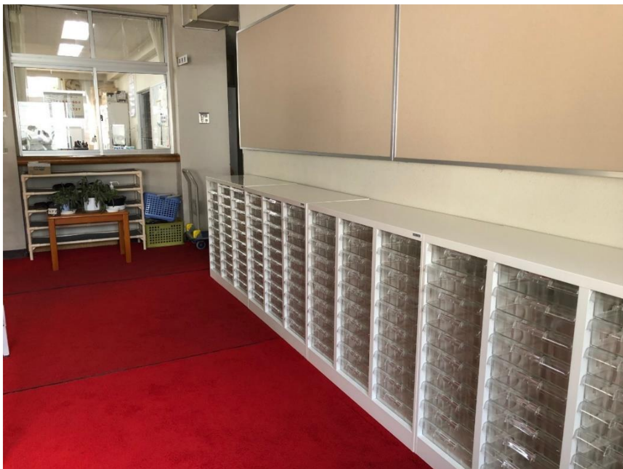
学寮事務室前のレターボックス