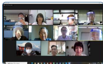
【オンライン患者会の様子】