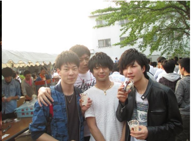
5年生も最後の寮祭を楽しんでもらえてよかったです！！