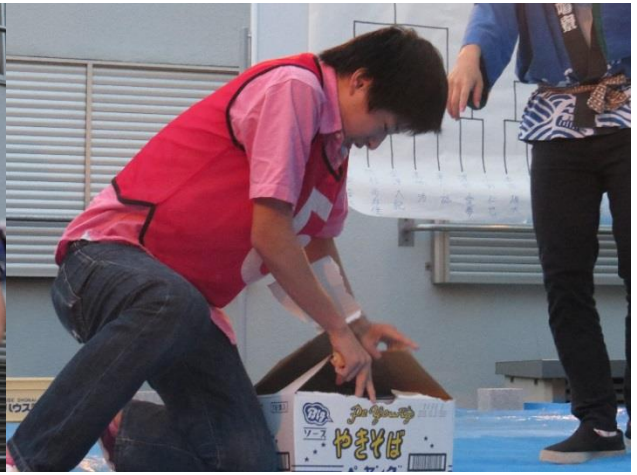
2位にはお菓子、優勝賞品はカップ焼きそばでした。今年も大変盛り上がりました！！ 続いて、じゃんけん・あっちむいてほい対決です