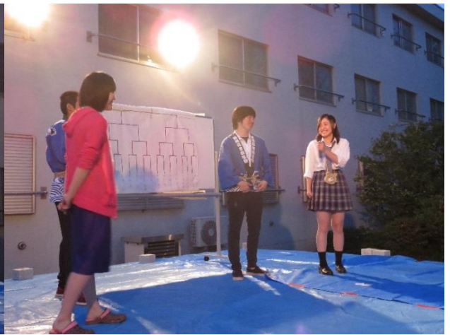
この企画には女子寮生がたくさん参加してくれました。