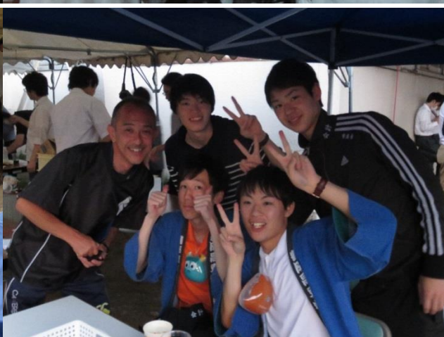
金券販売を行ってくれた文化委員お疲れさまでした。