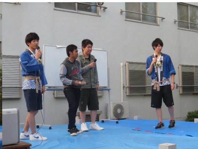
各部の模擬店紹介の様子です。