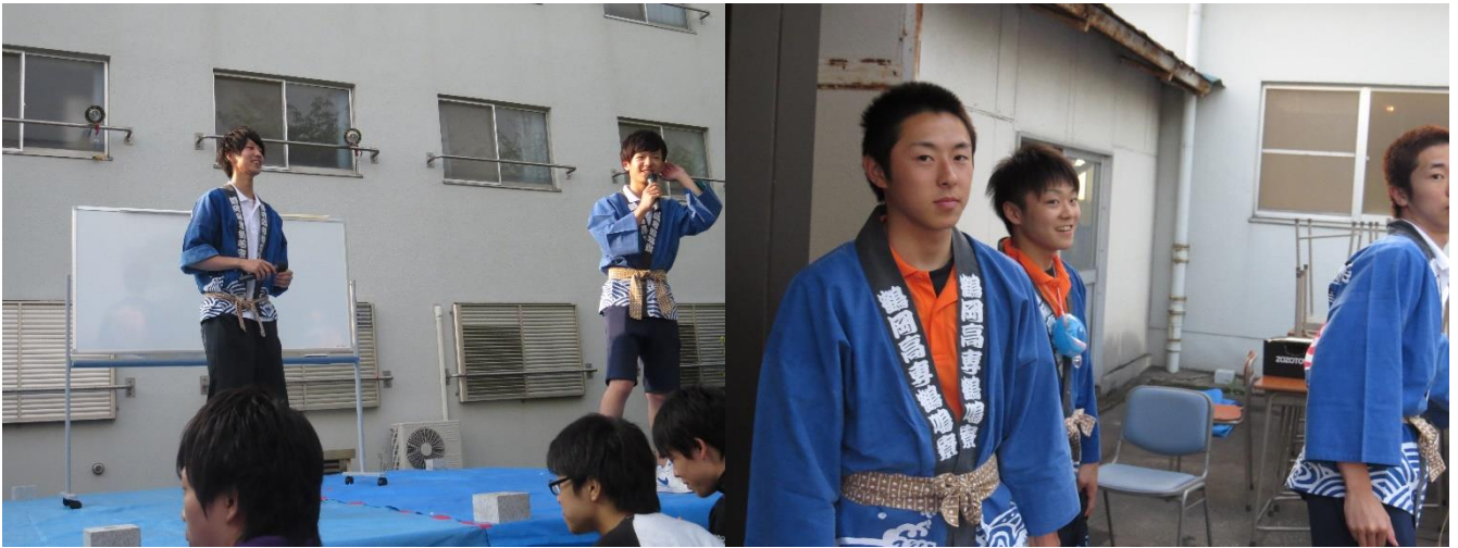
今年も寮生会は法被を着て運営です！

5月27日（金）に寮祭が行われました。今年は例年より早めの開催となりました。寮祭は年に一度の大イベントで寮のイベントの中でも最も盛り上がる行事の一つです。前日まで天候の不安もありましたが今年も外で開催することができました。