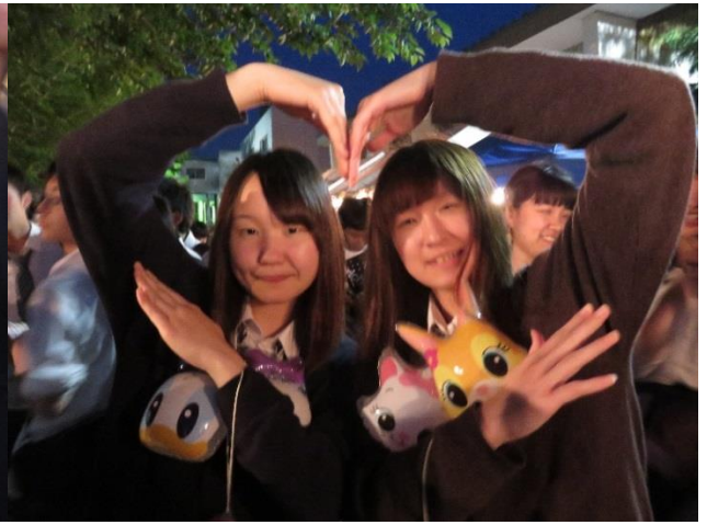
通学生にも楽しんでもらえたようです