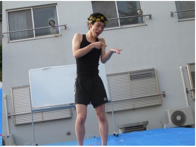
オープニングは2・3年寮生会が盛り上げてくれました。