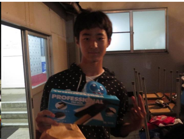
ビンゴになったひとには高額商品も！？