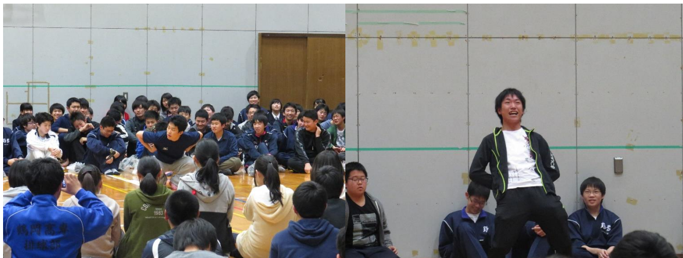
1年生も前に出て自己紹介をしてくれました。