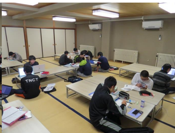
↑ 物質工学科の様子