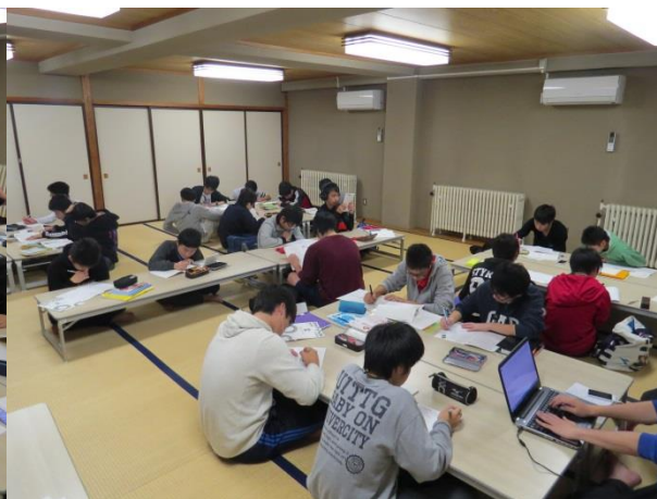
↑ 電気・電子工学科の様子