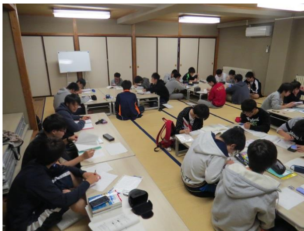
↑ 機械工学科の様子

今回は、11月25日～28日にある後期中間テストへ向けて実施されました。前回と同様に1年生を対象にして、勉強への意識向上を目的としての取り組みです。