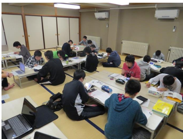
↑ 制御情報工学科の様子