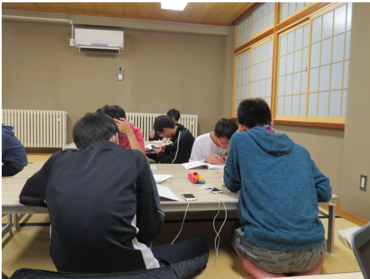
↑ 居残り勉強をしている様子 ↓