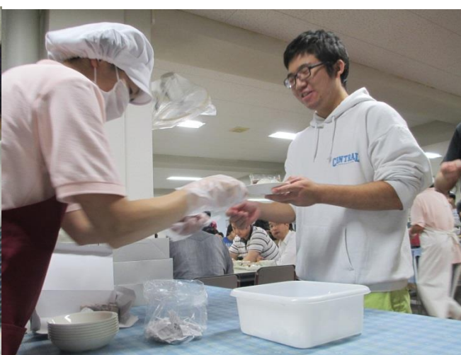
↑そんなに盛って大丈夫ですか？