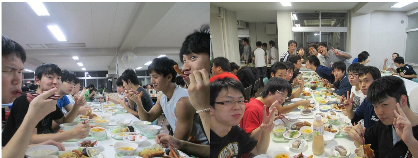
↑ 5年生も最後のバイキングを堪能していました。