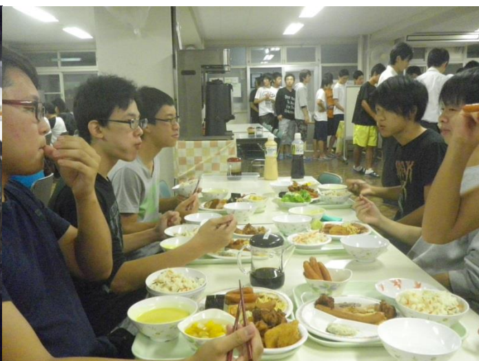
↑ 皆さん楽しそうに食べていました。