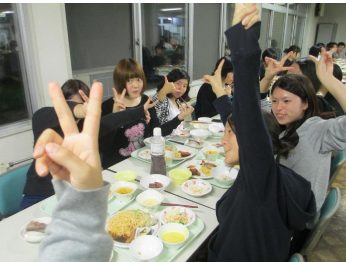
↑ 女子寮生も楽しそうです！