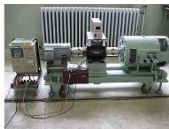
インバータによる誘導電動機速度制御