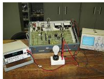
サイリスタによる交流電圧制御