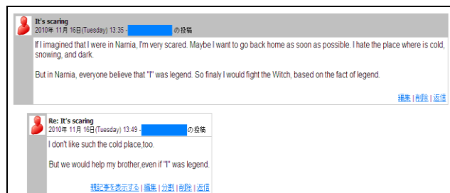
洋画を活用したeラーニング教材の例 (平成 22 年度「語学演習」)