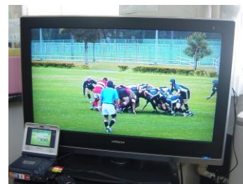
ラグビーのゲーム分析