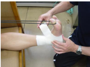
スポーツテーピング