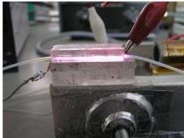
テフロンチューブ内壁処理