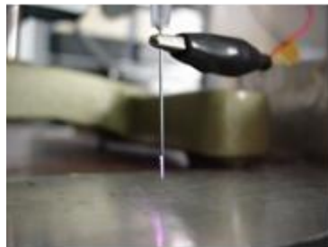
大気圧 \mu プラズマジェット

2.45GHz マイクロ波を用いた幅 400~500 mm の細長い矩形プラズマの生成技術，当矩形プラズマを用いたシート状処理物(ポリマーフィルムや金属薄板)の表面処理への応用研究を行っている。