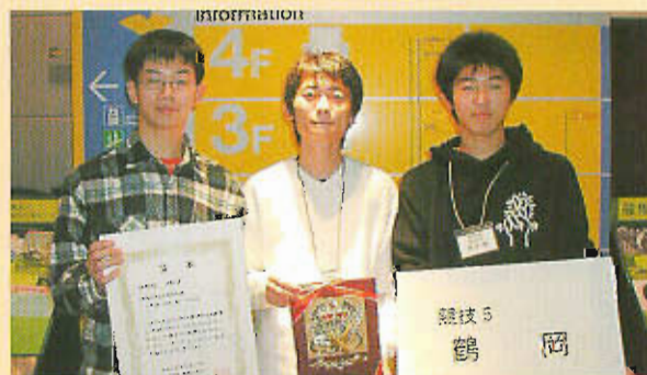
▲プロコンの全国大会へ