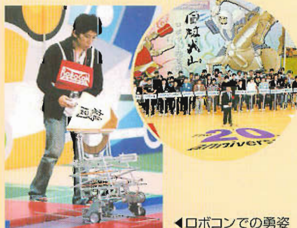
◀ロボコンでの勇姿